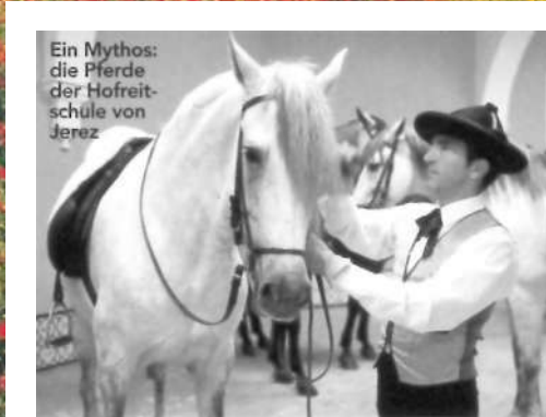
Ein Mythos: die Pferde der Hofreiterschule von Jerez