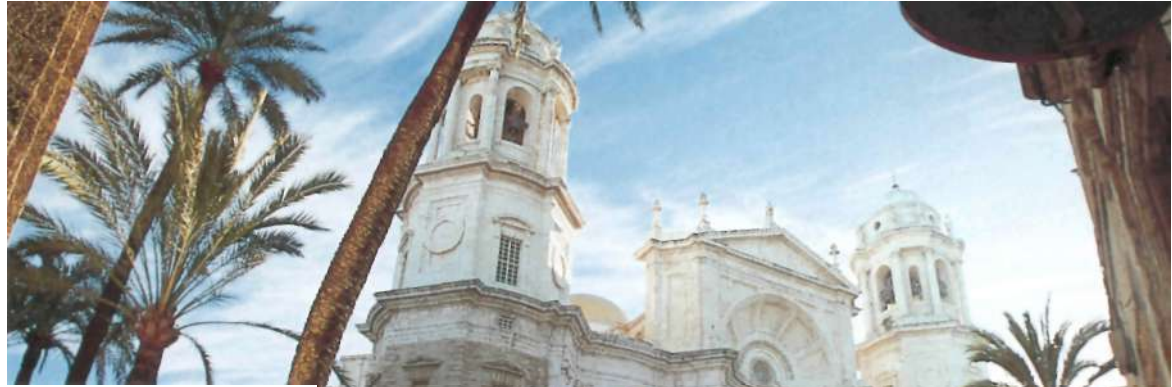
Die Kathedrale der pittoresken Hafenstadt Cádiz