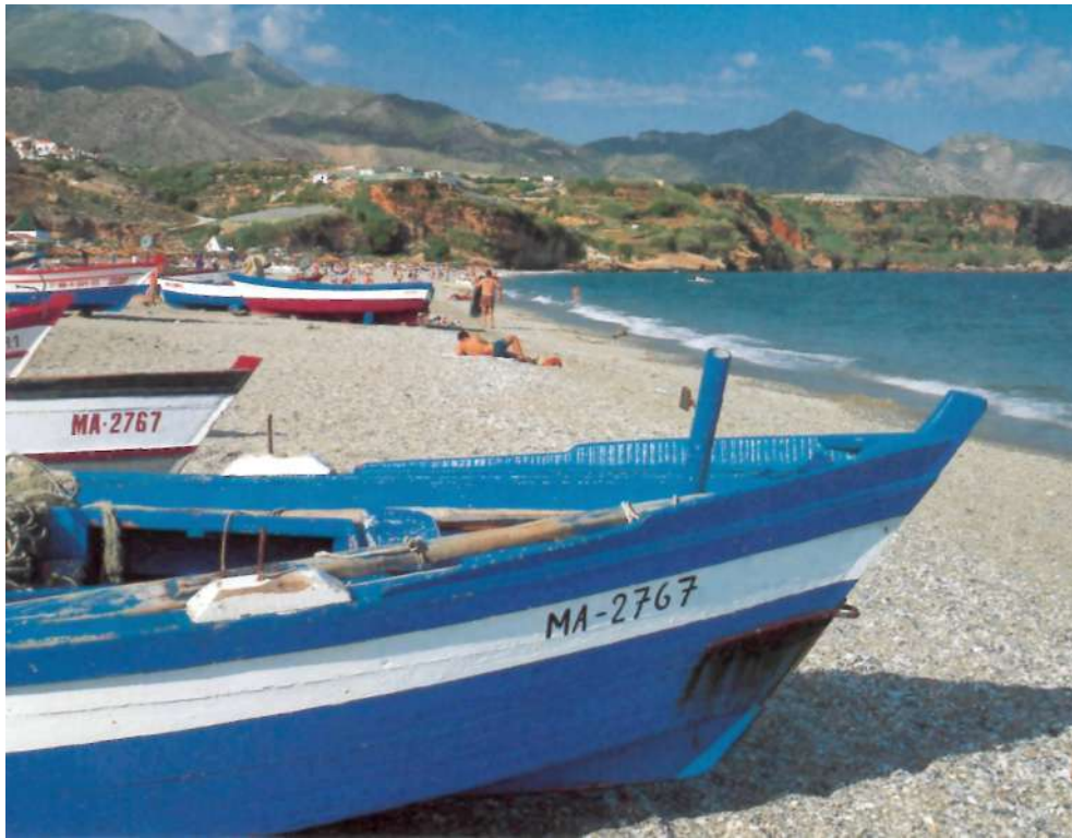
Anders als an Andalusiens Mittelmeerküste Costa del Sol hält sich der Tourismus an der Costa de la Luz in überschaubarem Rahmen - wie hier in Zahara de los Atunes, dem Zentrum des Thunfischfangs