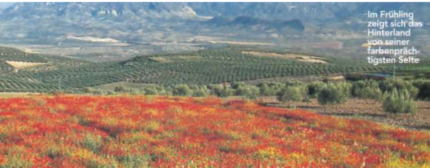
Im Frühling zeigt sich das Hinterland von seiner farbenprächtigsten Seite