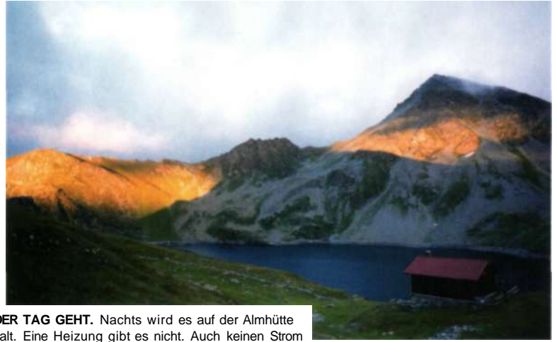
DER TAG GEHT. Nachts wird es auf der Almhütte kalt. Eine Heizung gibt es nicht. Auch keinen Strom oder warmes Wasser. Aber wozu das Telefon aufladen, wenn es eh keinen Empfang gibt?