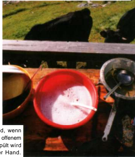
JAUSE. Gekocht wird, wenn überhaupt, auf offenem Feuer. Und abgespült wird mit der Hand.