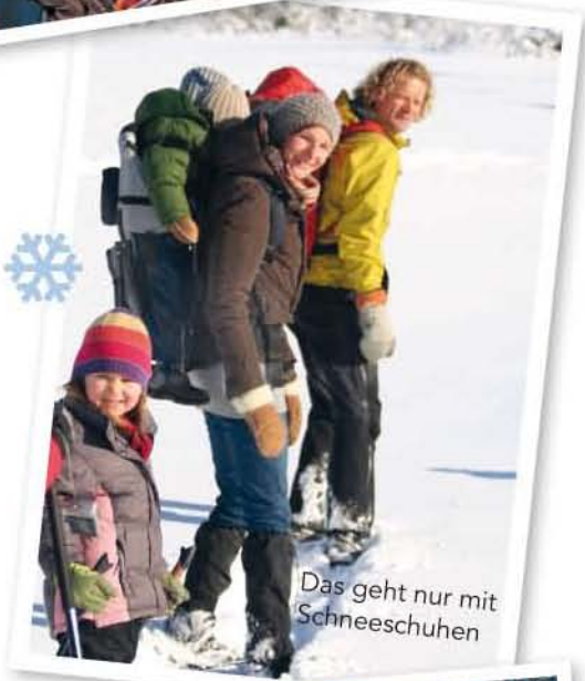
Das geht nur mit Schneeschuhen