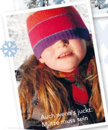
Auch wenn's juckt: Mütze muss sein