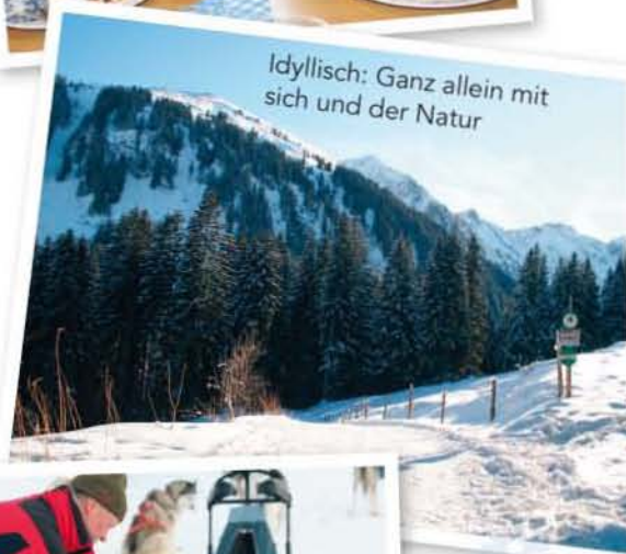
Idyllisch: Ganz allein mit sich und der Natur