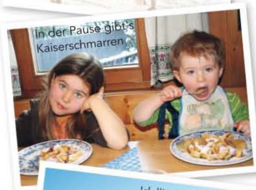
In der Pause gibt's Kaiserschmarren