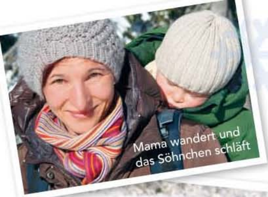
Mama wandert und das Söhnchen schläft