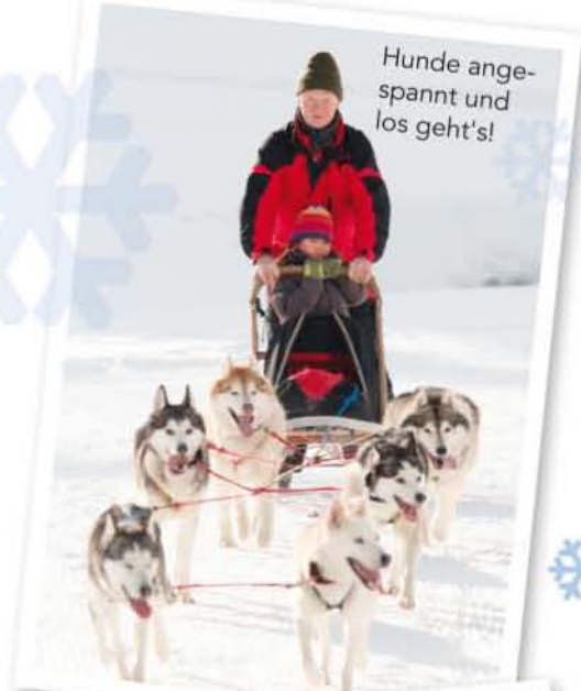
Hunde angespannt und los geht's!