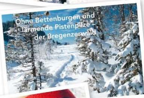
Ohne Bettenburgen und lärmende Pistenpilze – der Bregenzerwald